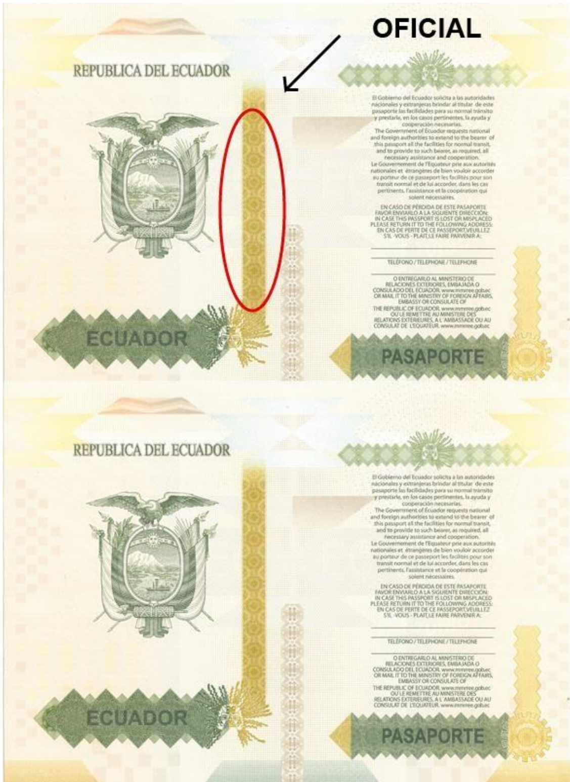
Imagen 2.1 Ubicación de la palabra OFICIAL en la contratapa anterior.